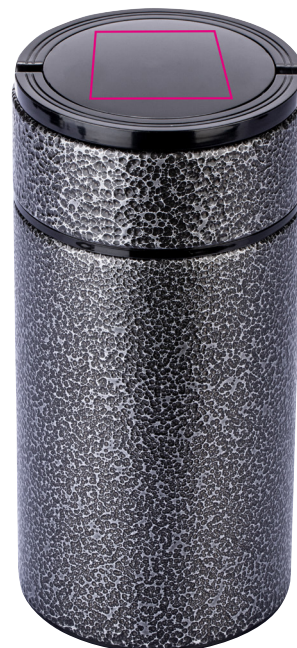
Abbildung oben 1:1

Thermo Speisebehälter / Food-Container inkl. klappbarem Löffel im Deckel, Fassungsvermögen: max. 900 ml (ca. 30 oz), für Getränke, warme Speisen, Salate und Suppen, Doppelwand-Isolierung mit Vakuum, auslaufsicher, Drehverschluss, Kunststoffdeckel (BPA-frei), lebensmittelecht (LFGB geprüft), breite Öffnung zur besseren Befüllung, Entnahme und Reinigung, Inhalt bleibt für bis zu 8 Stunden warm, 2 Tragegriffe (Henkel), 201 Edelstahl, 304 Edelstahl, Kunststoff, matt, schwarz/titanfarben