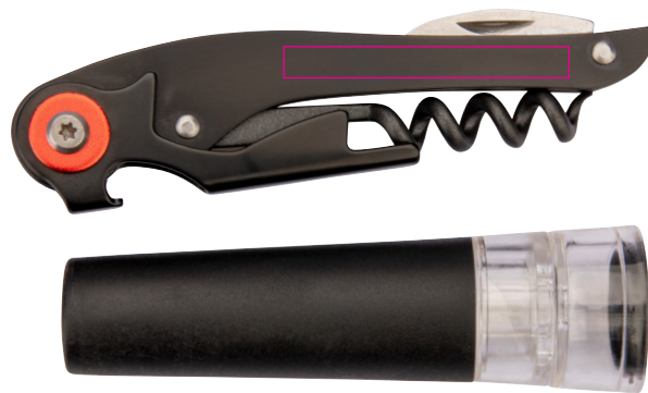
Abbildung oben 1:1

Wein-Set aus Kellnermesser und Vakuum-Flaschenverschluss, Korkenzieher ausklappbar, mit Messer und Kapselheber, Spindel antihafbeschichtet, Silikonverschluss passend für verschiedene Flaschengrößen, lebensmittelecht, ABS, Edelstahl, Silikon, matt, rot/schwarz