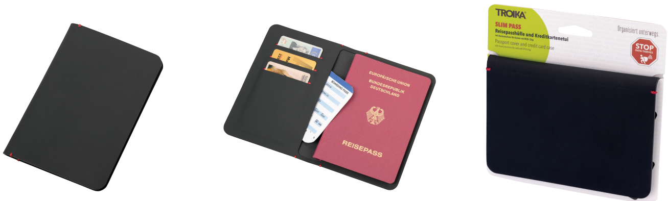
Abbildung oben 1:1

Reisepasshülle und Kreditkartenetui, 2 große Einsteckfächer für z. B. Reisepass, Boardingpass und Geldscheine, 3 Kartenfächer mit Ausleseschutz (für RFID Chips), Etui nahtlos verschweißt, Oberfläche antibakteriell, Kunstleder, rot/schwarz