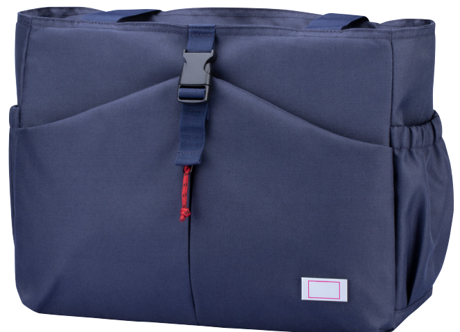
Abbildung oben 1:1

Kühltasche als Schultertasche für Business und Einkauf aus 100% recyceltem rPET Material (zertifiziert nach Global Recycled Standard), Hauptfach mit isoliertem, wasserdichtem 2-Wege Reißverschluss und langlebigem, hochwertigem Thermo-Innenfutter (Kühl- und Warmhaltefunktion), Geheimfach oben für Schlüssel und Handy, Reißverschlussfach vorne, Fronttasche mit Steckverschluss, 2 Stecktaschen außen (z.B. für Schirm + Flasche), Kapazität ca. 13 Liter, Tragkraft bis zu 6 kg, extra lange Tragegurte mit Schulterpad, Schlaufe zur Befestigung am Trolley, EVAC, rPET, dunkelblau