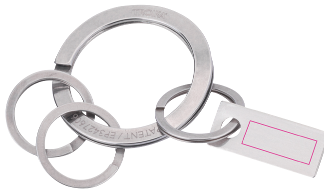
Abbildung oben 1:1

Schlüsselanhänger, schnelles & einfaches Anbringen der Schlüssel dank patentiertem Öffnungsmechanismus, inkl. 3 kleiner Ringe ebenfalls mit patentierter Mechanik, fingernagelchonend, Edelstahl, poliert, matt, silberfarben