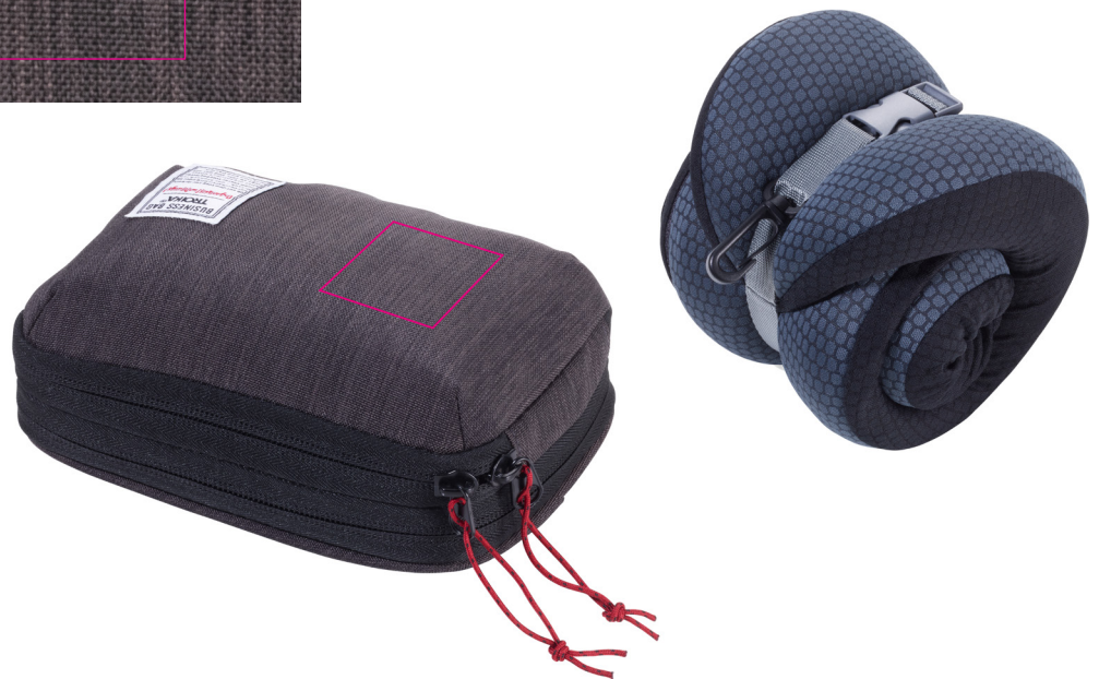
Abbildung oben 1:1

Nackenkissen in Kompressions-Tasche, Kissen platzsparend einrollbar (mit Klick-Verschluss), Memory Foam (Memory-Schaum): dauerhaft formstabil, behält ursprüngliche Nackenkissen-Form nach Einrollen, für Zug, Auto, Flugzeug, Sofa, Bezug abnehmbar/waschbar, stabilisiert/entlastet den Nacken- und Schulterbereich durch optimale Stützung des Kopfes, STANDARD 100 by OEKO-TEX®, Polyester, grau/schwarz