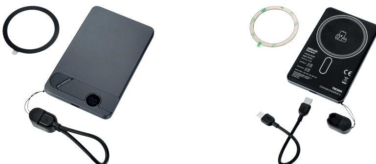
Abbildung oben 1:1

Powerbank 3-in-1 mit 5000mAh, kabelloses Schnellladen (bis 15W) von Smartphones, Kopfhörern und Smartwatches, kompatibel mit MagSafe, ermöglicht kabelloses Laden unterwegs durch magnetische Fixierung auf der Smartphone-Rückseite, mit LED-Ladestandanzeige und ausklappbarem Metallständer für horizontales und vertikales Aufstellen des Handys, inkl. 20W Power Delivery USB-C auf USB-C Schnellladekabel, an der Powerbank fixierbar, inkl. zusätzlichem MagSafe Metallring mit 3M Klebefläche zur individuellen Befestigung an allen gängigen Smartphones, ABS, Aluminium, grau/schwarz