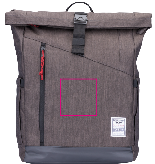
Abbildung oben 1:1

Roll Top Rucksack mit Steckverschluss aus Metall, Hauptfach mit Reißverschlussfach und 2-fach unterteiltem Einschubfach mit Klettverschluss, inkl. Geheimfach für mini Tracking-Geräte (z.B. APPLE AirTag®), Fronttasche mit Reißverschluss, 2 Seitentaschen, rückseitiges Geheimfach, gepolsterte Schultergurte, Schlaufe zur Befestigung am Trolley, abgesetzter Standboden, Kapazität ca. 15 Liter, Tragkraft bis zu 15 kg, 100% Polyester, Polyester, anthrazit/schwarz